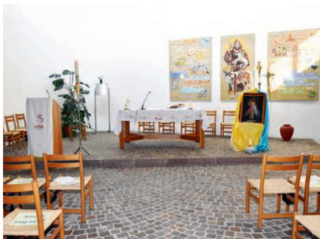
Cappella vuota domenica della Misericordia 2020

Abbiamo fatto fatica a non poter fare le cose che eravamo abituati di fare con le restrizioni da parte del Governo che ci sono state date. Niente più abbracci, strette di mano, né visita ai parenti, genitori, amici, neanche ai nostri cari in ospedale.