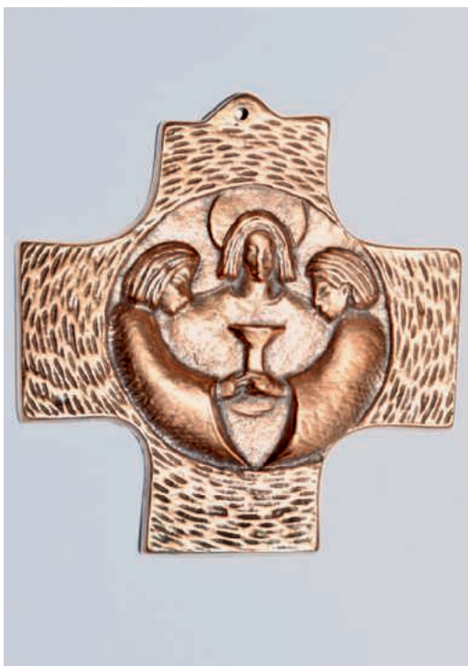
Cover Fonte: Altare della cappella Kloten