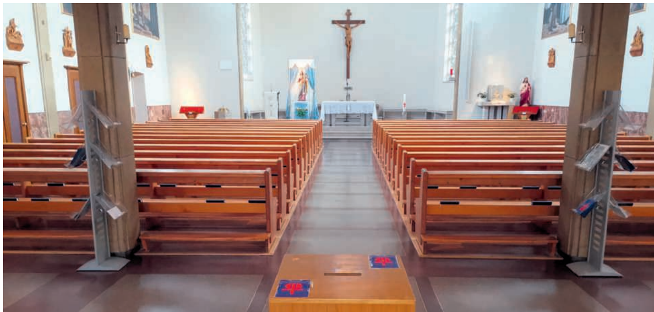
La nostra Chiesa in tempo di coronavirus

Il mese di maggio è il periodo dell'anno che più di ogni altro fa riferimento alla Madonna. È un tempo in cui si moltiplicano i rosari recitati a casa e si sente più forte il bisogno di preghiere speciali alla Vergine soprattutto in questo periodo di pandemia. La nostra chiesa a Zurigo, la Missione Cattolica di Lingua Italiana, è ancora avvolta in un rigoroso silenzio e privata del fervore dei fedeli, seppur le sue porte restino costantemente aperte e i riti quotidiani condivisi sul web. La vita sta andando avanti, sono fiorite numerose iniziative legate a ricorrenze e celebrazioni a distanza e si è solidali, in un cammino di compagnia al «telefono», con chi è anziano e solo. Il popolo di Dio si è mosso, come Cristo aveva chiesto: «Datevi da fare. Non solo per il cibo che non dura,