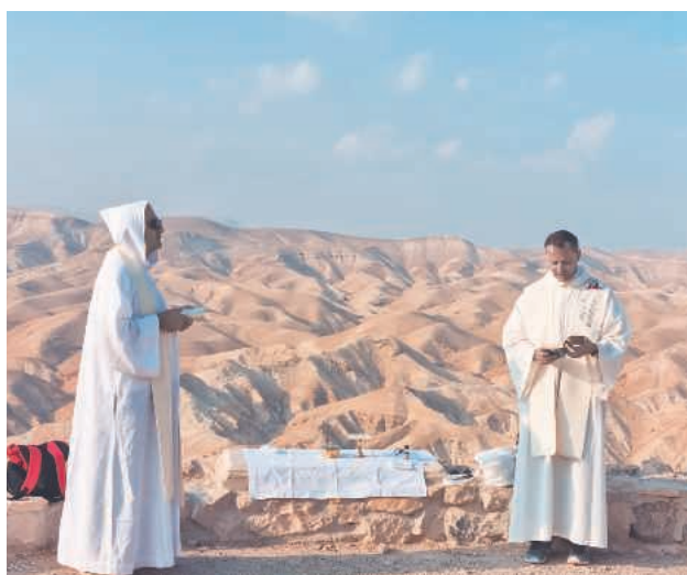
Santa Messa nel deserto di Giuda