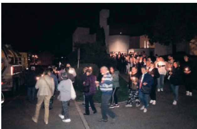
Processione dopo la S. Messa