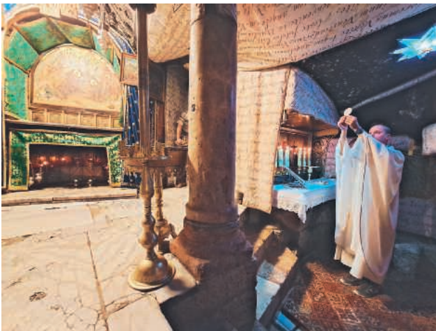
Betlemme, grotta della natività, Santa Messa