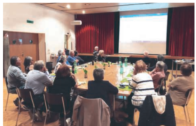
Incontro di formazione