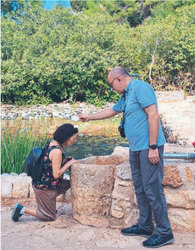
Fiume Giordano, rinnovo delle promesse battesimali