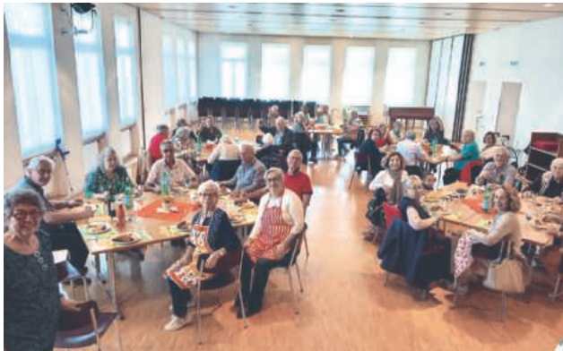
Grigliata dei pensionati a Rüti-Tann a settembre