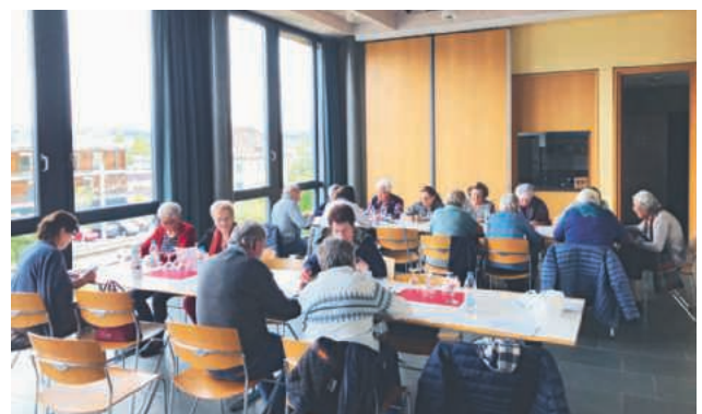
Incontro dei pensionati a Stäfa