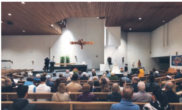
S. Messa Mariana a Hombrechtikon a ottobre