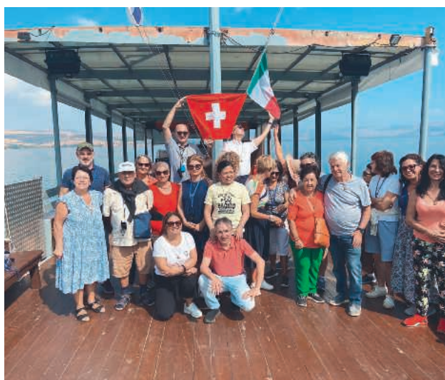
Lago di Tiberiade

Ci ha fatto soprattutto riflettere sul nostro modo di vivere la fede: il canto del muezzin che ci svegliava all'alba e ci salutava al termine della giornata come a ricordarci che tutto si origina e si compie in Dio, o la preghiera dell'ebreo ortodosso davanti al Muro del pianto con la Sacra Scrittura in mano a testimoniare la centralità della Parola di Dio per noi. Quanto abbiamo da imparare da quel popolo. Si tratta senza dubbio di una terra di contraddizioni, di povertà, di conflitti, ma essa ha molto da dare a chi sa guardare. Nazareth, dove Gesù ha vissuto la maggior parte della sua vita, Betlemme dove è nato e Gerusalemme dove ha compiuto la sua vita in obbedienza al volere del Padre: queste le tappe più significative del nostro viaggio, insieme a Gerico dove Gesù ha incontrato Zaccheo, il fiume Giordano dove ha ricevuto il battesimo da Giovanni Battista, Cafarnaò, Cana, il lago di Tiberiade, il monte Tabor... Abbiamo lasciato quella terra dove ogni cosa è intensa, forte, estrema con il fermo desiderio di ritornarvi.