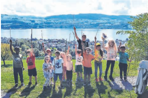
Grigliata del gruppo mamme-papà-bambini a settembre