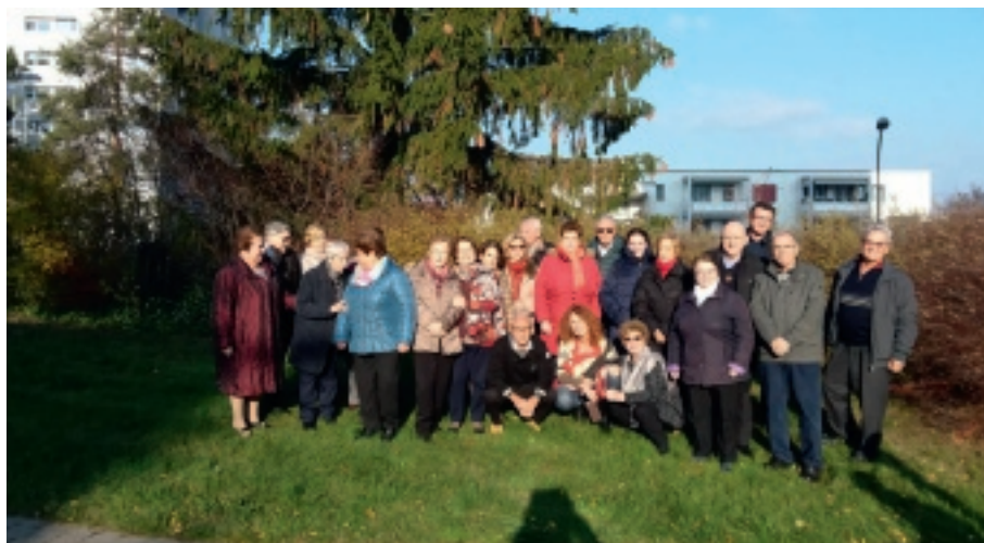
Il Gruppo dei vincenziani

C'è un gran da fare, qui a Zurigo, per i volontari vincenziani! Nei prossimi giorni saranno molto impegnati nell'organizzare la vigilia di Natale per le persone sole e povere! Sono tutti molto diversi tra loro, per età, per storia personale, per cultura, ma i vincenziani con il loro carisma e dedizione arrivano laddove c'è bisogno ... laddove Dio vuole!