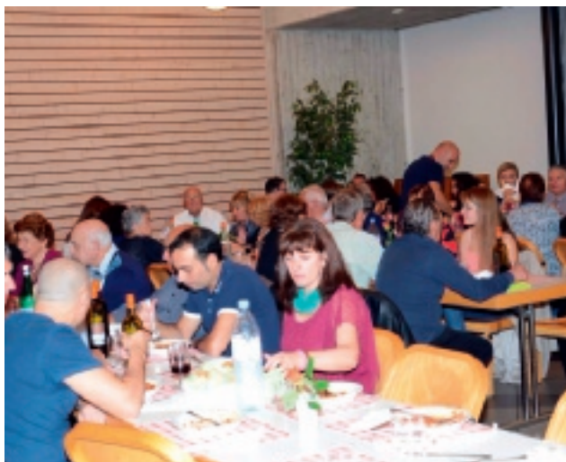
Festa dei popoli con la comunità svizzera il 18.11.18