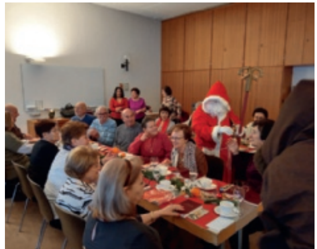
Babbo Natale è venuto a trovare i nostri Seniores.