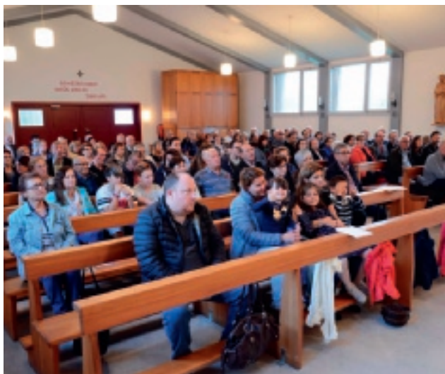
Festa del pane il 6.10.18 ad Obfelden