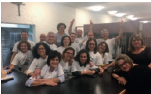
STAFF OVER 40 – CASTAGNATA