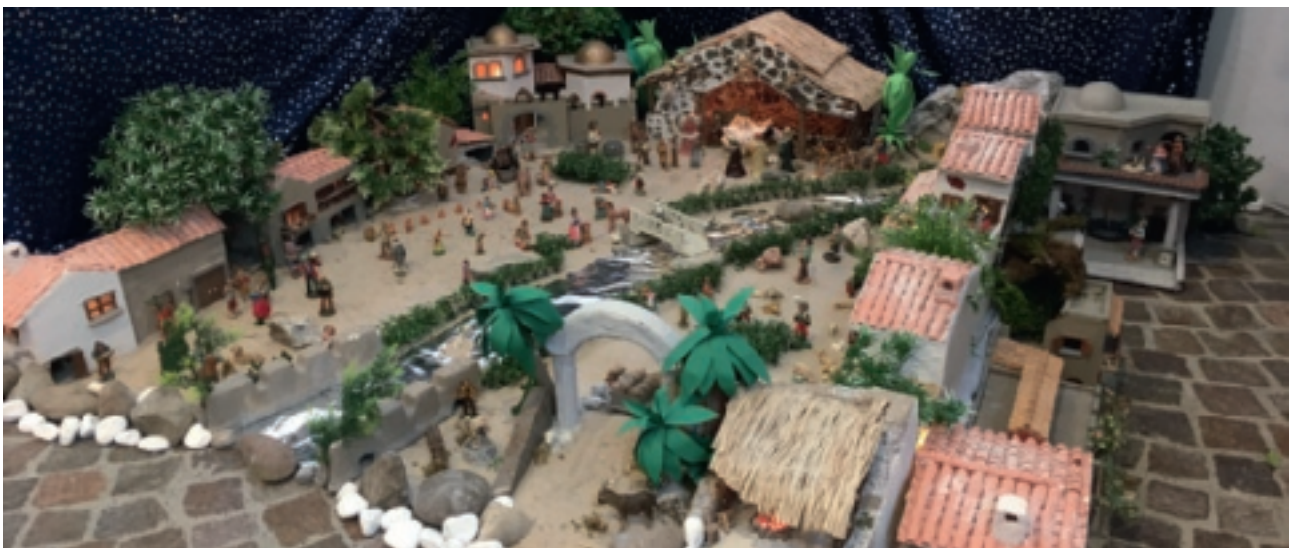
Presepe nella nostra Cappella

Un cordiale e sincero augurio di buon Natale e felice anno nuovo, con la speranza di una bellissima e duratura collaborazione anche in futuro.