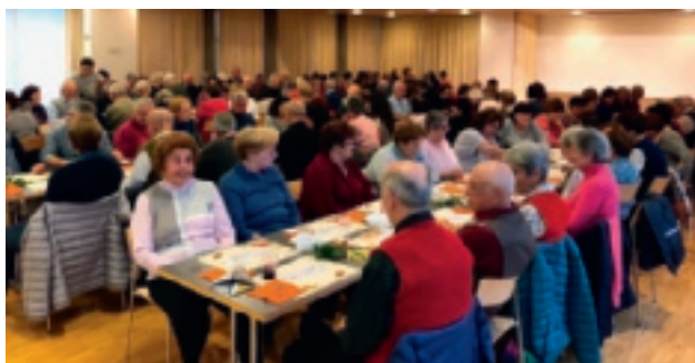
CASTAGNATA 3ª ETÀ 2018