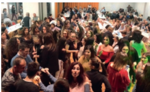
CASTAGNATA COMUNITARIA 2018